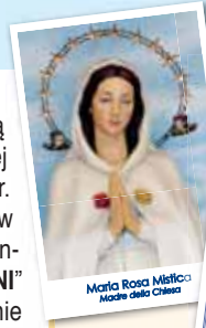
Maria Rosa Mistica: Madre della Chiesa