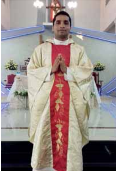
Priester voor altijd

Maandelijks nieuwsbericht van de Stichting Rosa Mistica - Fontanelle Montichiari (Bs) - Italy