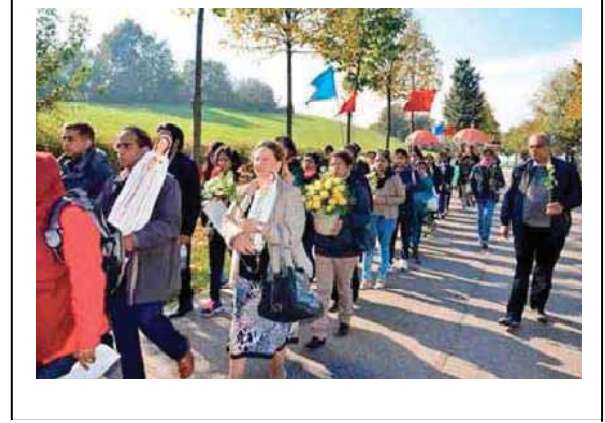
فونتانييل 1 و 2 تشرين الثاني 2014 عديد من تماثيل مريم الوردة السرية احضرتها عائلات هندية مقيمة في سويسرا وملتزمة بالحركة المريمية، اتوا الى فونتانييل وامضوا يومين في الصلاة.

سلام وحب وفرح ورحمة الرب يكونوا معنا جميعا في أسرنا، في الكنيسة وفي العالم. جمعية مريم الوردة السرية - فونتانييل