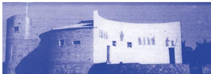
Sanctuaire de Mère de la Miséricorde (Maria Rosa Mystica)

■ Du Burundi - Quarante ans avec Marie Rosa Mystica Années de silence, d'amour et de souffrance. Amour pour notre Père céleste, pour Jésus et Marie. Amour pour les petits orphelins abandonnés, amour pour les pécheurs que je reçois chaque jour au confessionnal, amour pour Jésus Eucharistie que nous adorons et nous célébrons chaque jour dans les hôpitaux.