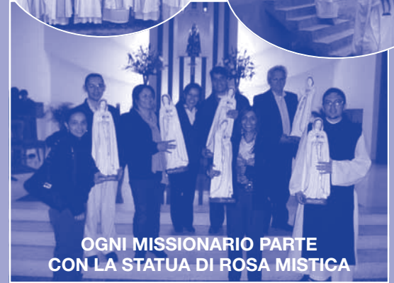
OGNI MISSIONARIO PARTE CON LA STATUA DI ROSA MISTICA