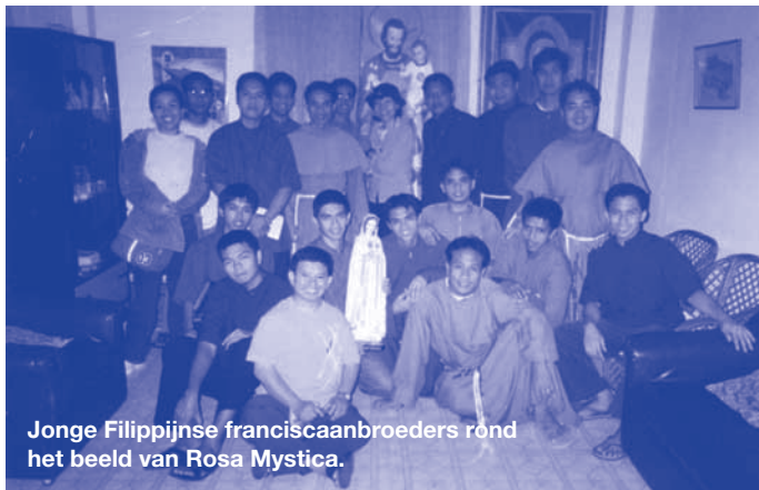
Jonge Filippijnse franciscanbroeders rond het beeld van Rosa Mystica.