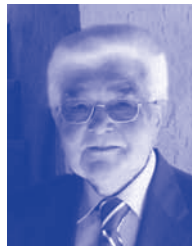
De Associatie Rosa Mystica Fontanelle.