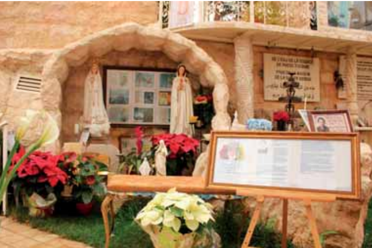
Bendición con el icono de María Rosa Mística.