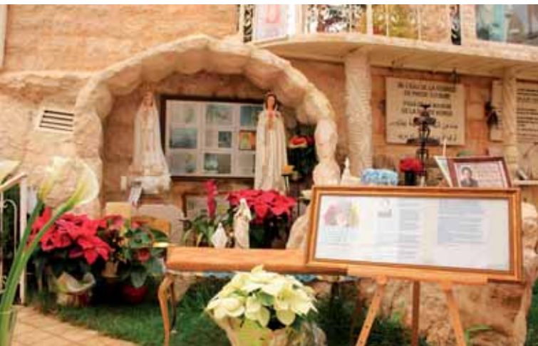
Błogosławieństwo ikoną Marii Rosa Mystica.