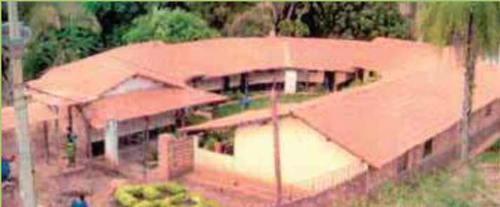
المدرسة الزراعية لأسرة ماريا روزا ميستيكا.

■ من البرازيل نتلقى شهريا بكثير من الفرح مجلة ماريا روزا ميستيكا التي تطلعننا على كافة النشاطات في فونتانيل. خاصة المبشرين وكل الذين سبق ان زاروا فونتانيل يتذكرونه بحب وحنين . فونتانيل هي ملجأى الروحي الوحيد ، ما إن اذكر اسمها حتى اعيش من جديد اجمل لحظات قضيتها تحت اقدام مريم، وانا اصلي زاحفا على الدرج الصغير، او مع تلاوة المسبحة في الحوض. بعد هذا التأمل اعود جسديا وروحيا لأتابع المهمة التي اوكلتني بها ماريا روزا ميستيكا. في هذه الأيام انا بأمس الحاجة الى وجودها. هي وحدها بإمكانها مساعدتنا. إنها "أمناء".