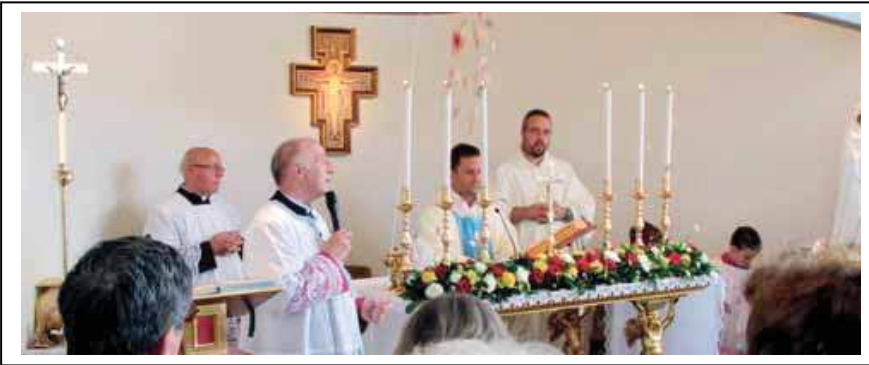
مطر من اوراق الورد على المذبح

الملاك جبرائيل يعلن لفتاة عبرية انها إذا وافقت سيولد منها المخلص. ومن هذه الكلمات القليلة، توضحت لها الحقائق فإبتمدت قوتها من الله. "ها أنا أمة الرب" "فليكن لي بحسب قولك". دائما" نذكر كيف تمّ الحدث بإختصار معبر وبطاعة للربّ . أمام إرادة الله مريم بطلة القصة اجابت بطاعة وبتواضع. "أنا أمة الربّ فليكن لي بحسب قولك " .