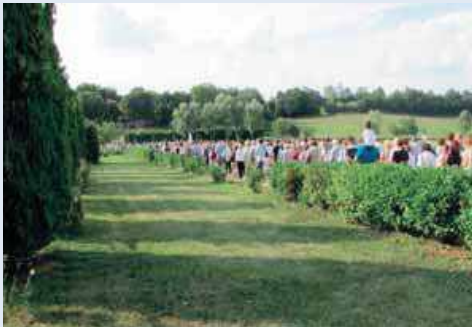
مسيرة طويلة على شرف ماريا روزا ميستيكا

كانت هناك مجموعات كثيرة من الحجاج، وعدد هائل من الباصات إضافة الى مجموعات من العائلات اتت مع بعضها. الإكليريكي شاشيكا إستقبل عدد كبير من العائلات السنغالية. وبعد الصلاة إفتروشوا الحقل المليء بالورود في إستراحة الغذاء. وعند الساعة الثالثة من بعد الظهر اقمنا ساعة سجود مع صلوات فردية وجماعية. من جديد إحتشد عدد كبير من المؤمنين امام كراسي الإعراف . وإحتفل بالذبيحة الإلهية المندوب الأسقي وفي نهاية القداس اقيم زياح ومسيرة بإتجاه الصليب الكبير لتبريك الورود. وكمية الورود ايضا لم تكن كافية بالرغم من ذلك لم يذهب احد خالي اليدين اذ حصل كل مؤمن على بركة من يد امه مريم إن كانت حمراء ، بيضاء ام صفراء. وكان هذا اصدق واجمل شيء في هذا العيد.