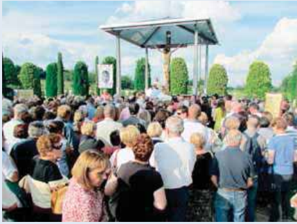
توزيع الورود المباركة على الحجاج